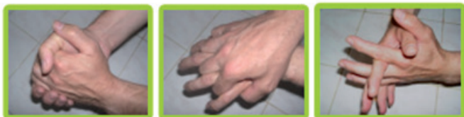
Paume contre paume