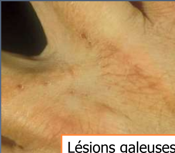
Lésions galeuses interdigitales