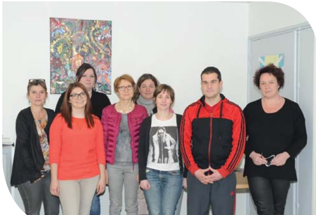
Equipe de l'hôpital de jour d'addictologie